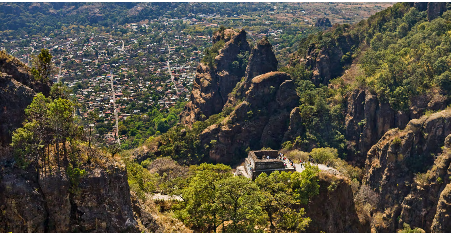
Fig. 3. Cerros que rodean el pueblo de Tepoztlán. https://www.mexicoenfotos.com/MX14717879673777.jpg [consultado en Mayo 2018].