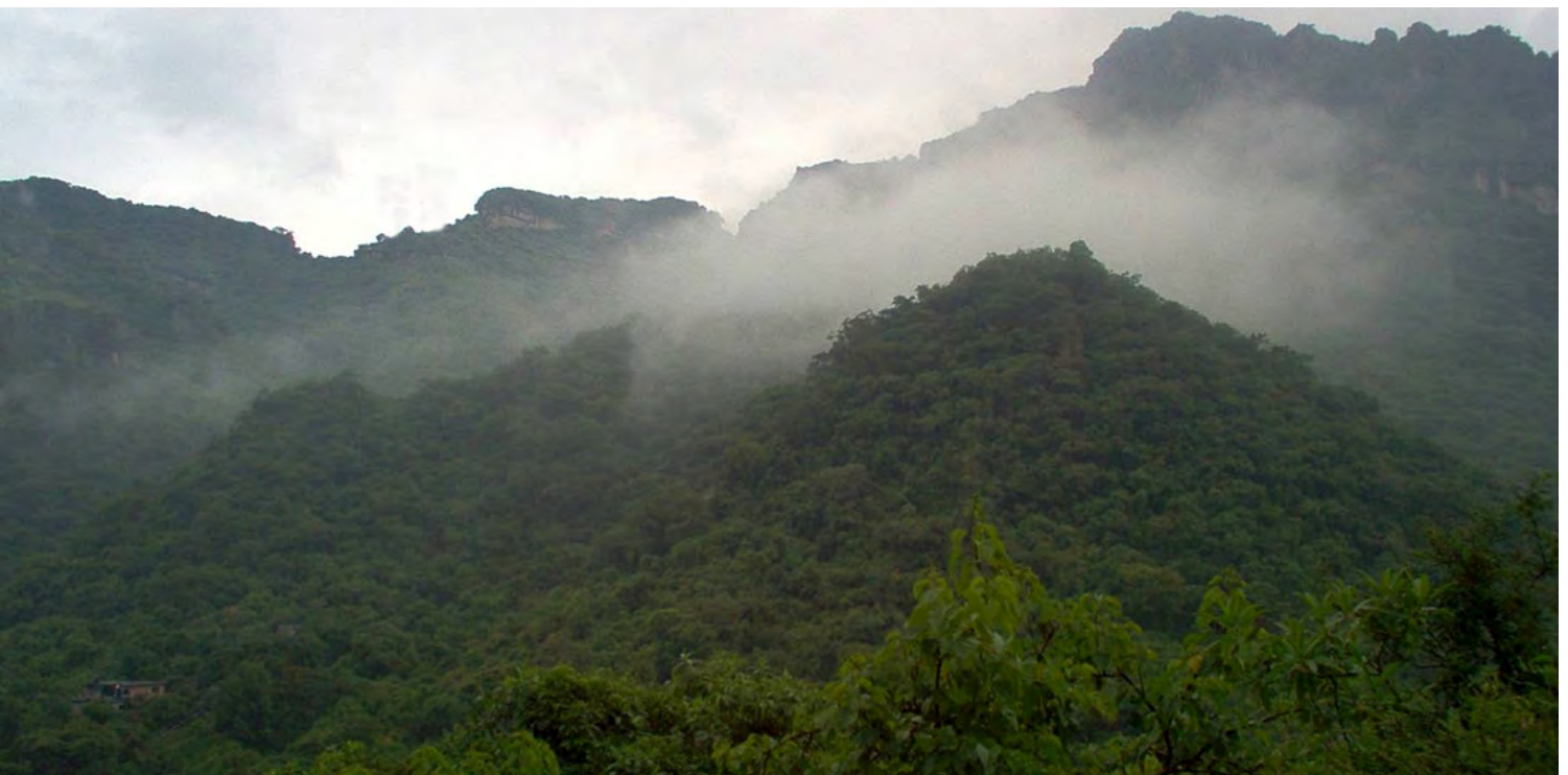
Fig. 5. Corredor biológico Chichinautzin. http://chichinautzin.conanp.gob.mx/ [consultado el 10 de Octubre 2018].

El corredor biológico Chichinautzin es un área de contención ante el crecimiento de las ciudades de México y Cuernavaca, cuenta con una notable diversidad de hábitats y especies debido a sus condiciones geográficas y climáticas privilegiadas. Se encuentra en la zona noroeste de Morelos y abarca 12 municipios de ese estado, uno en el Estado de México y las delegaciones políticas de Milpa Alta y Tlalpan al sur de la Ciudad de México. Su superficie de 65,721 hectáreas, incluye las 4,562 del Parque Nacional Lagunas de Zempoala y las 23,286.51 del Tepozteco, zonas que también forman parte de este amplio corredor biológico que sustenta a la flora y fauna locales, convirtiéndose en una zona de amortiguamiento para el Valle de Cuernavaca. El Corredor Chichinautzin fue decretado Área de Protección de Flora y Fauna el 30 de noviembre de 1988 (SEMARNAT, 2016).