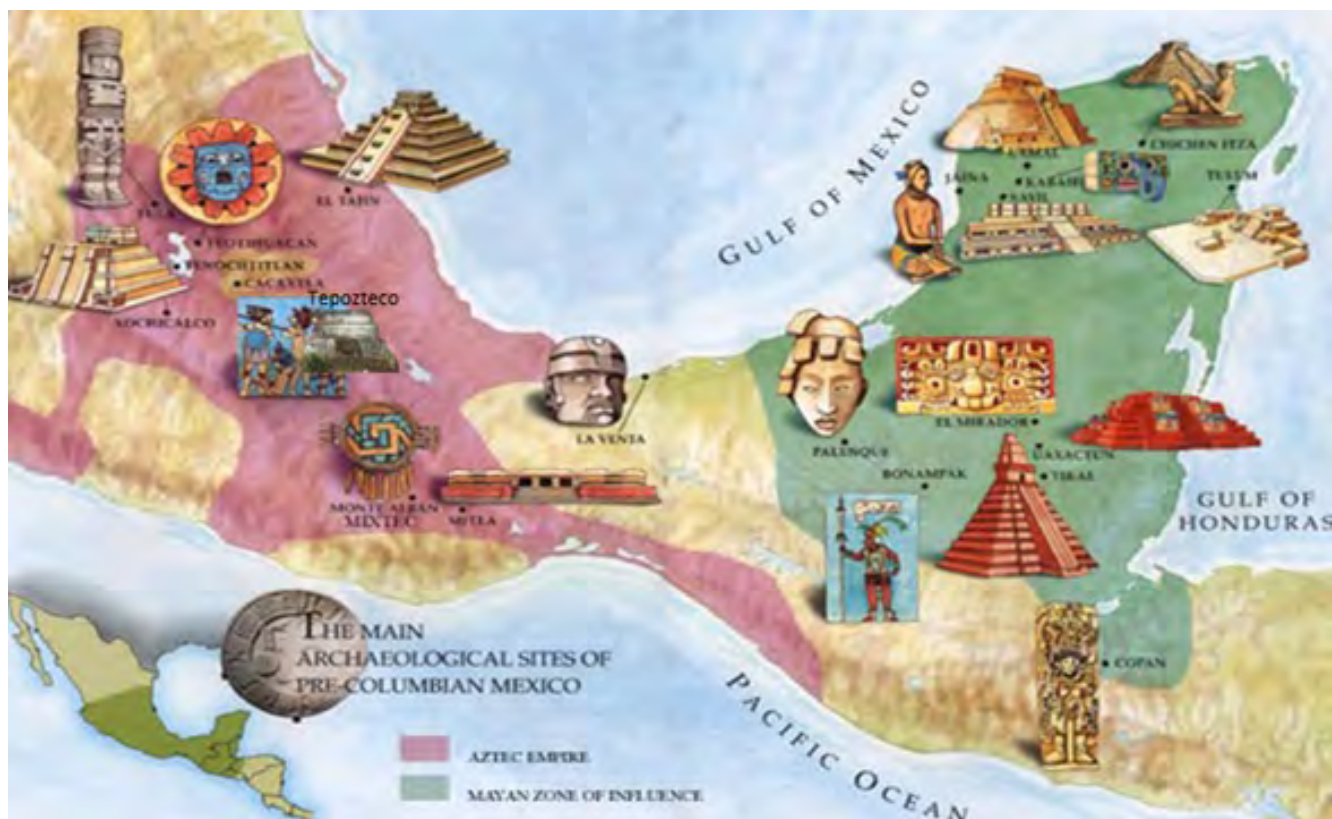
Fig. 2 Mapa de Culturas en Mesoamérica. https://www.dependiendo.com/culturas-mesoamericanas-areas/ [consultado el 10 de Octubre 2018]

En vísperas de la conquista hay evidencia del culto a la tierra, en los cerros y las cuevas, según lo señala la relación de Tepoztlán de 1580 y lo demuestran los restos arqueológicos (BRODA Y MALDONADO, 1996-1997). El dios Tlaloc-Tlaltecuchtlí representaba los fenómenos naturales (CARRASCO, 1979). Es así como se sustenta la importancia del paisaje natural para la sociedad de Tepoztlán a través de los años y la concepción mítica y sagrada que poseen de su entorno.