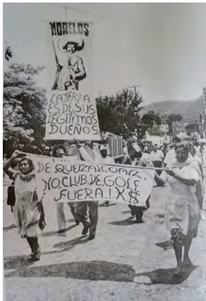
Fig. 6. Morelenses de varios pueblos y ciudades se dan cita en Tepoztlán para solidarizarse en la defensa de las tierras comunales (ROSAS, 1997). Tepoztlán crónica de descatos y resistencia, primera edición, México.

Las poblaciones autóctonas, como la Tepozteca, reaccionaron de forma colectiva y afirmativamente, impugnando, repeliendo y resistiendo a las autoridades locales, estatales y las federales para contener la imposición de las políticas neoliberales y las presiones del capital sobre su territorio étnico; generando una avalancha de respuestas sociales, acciones y discursos políticos nutridos por los códigos culturales emblemáticos de la identidad tepozteca. En este contexto emergió la figura de Tepoztécatl, héroe cultural, hermano menor de Quetzalcóatl, uno de los cuatrocientos conejos bebedores de pulque; representación del territorio, de la ética concreta y representación del mito de fundación del linaje tepozteca. Durante las movilizaciones, Tepoztécatl dejó constancia de su presencia como símbolo cultural, pues se dirigía a la población y la arengaba encabezando la protesta ante las autoridades por la arbitrariedad y agravios a su pueblo (BROTHERSTON, 1999), Por su investidura cultural y política, Tepoztécatl fue un símbolo en la lucha política al tiempo que un dispositivo político, referente de la ética concreta y la matria (GONZÁLEZ, 1984).