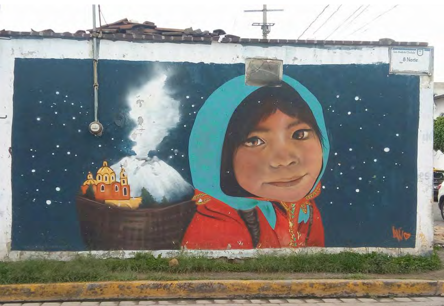
Fig. 3. Arte callejero: apropiaciones del patrimonio natural, cultural y su gente. San Andrés Cholula, 2017.