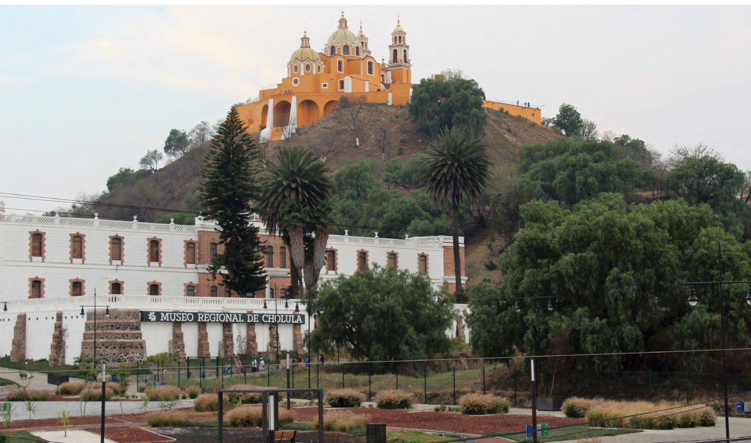
Fig. 4. Museo regional de Cholula , habilitado en el edificio del antiguo Hospital Psiquiátrico.

Además, el proyecto turístico contempló la apertura del Museo Regional de Cholula, para el cual se remodelaron las instalaciones del antiguo Hospital Psiquiátrico Nuestra Señora de Guadalupe (en el costado este de la zona arqueológica) que dejó de funcionar como tal en 2013 tras 103 años de operación. Este nuevo museo cuenta con colecciones provenientes de varios sitios y recintos, desde piezas prehispánicas, coloniales y muestras artesanales del estado de Puebla (figura 4). Fue inaugurado a inicios de 2017 junto con el Tren Turístico, el cual recorre un trayecto de 17 km desde la ciudad de Puebla sobre la antigua vía férrea rehabilitada y cuenta con una terminal totalmente remodelada en Cholula. Por último, siguiendo la tendencia al espectáculo que se ha dispuesto en varias zonas arqueológicas de México, se inauguró el videomapping o Experiencia Nocturna Cholula, que es un espectáculo de luz y sonido que presenta la leyenda fundacional de la antigua ciudad sagrada; se proyecta los fines de semana en el área abierta de la zona arqueológica.