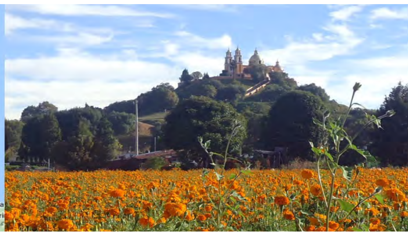
Fig. 1. Ubicación geográfica de Cholula y vista sur de la Gran Pirámide o Tlachihualtepetl, coronada por la iglesia de la Virgen de los Remedios.

En la Relación de Cholula de 1581, Gabriel de Rojas refiere que había multitud de ermitas donde se adoraban diferentes ídolos, destacando un “cerro grande” dedicado a Chiconahuiquiuitl –dios del agua o el que llueve mucho–, pero con el fin de erradicar estos cultos paganos los frailes franciscanos reemplazaron a las deidades mesoamericanas por católicas; así, en 1594 se construyó en la cima de la pirámide una ermita dedicada a la Virgen de los Remedios que se fue ampliando y adornando, hasta sufrir los estragos de un terremoto en 1864, por lo que volvió a erigirse conservando su estructura y disposición original, pero con una ornamentación neoclásica (DE LA MAZA 1959:20-23,102). Esta importancia religiosa trascendió la época colonial y se ha mantenido hasta la actualidad, siendo Cholula un importante centro religioso y comercial.