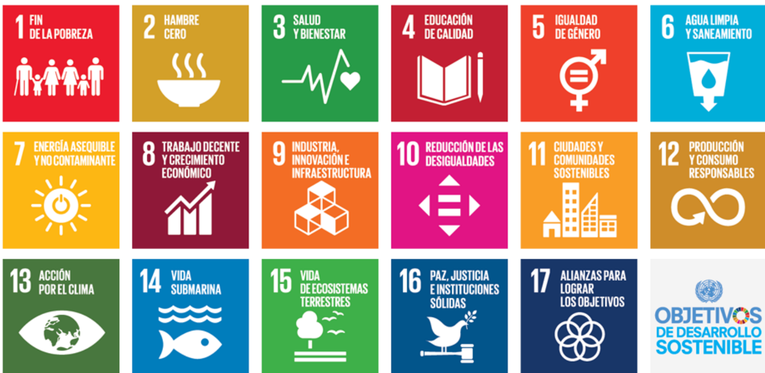
Figura 1. Objetivos de Desarrollo Sostenible planteados por la UNESCO.

Múltiples son los desafíos planteados por la UNESCO a través de sus ODS, centrándose sobre todo en aspectos de alimentación, agua y energía, así como el cuidado al medioambiente, hambre cero, cultura de paz, entre otros aspectos. Lo cierto es que todos ellos requieren de voluntades políticas, de iniciativas académicas, de la participación de los diversos miembros de las comunidades sociales y académicas e, ineludiblemente, de la generación de recursos y búsqueda de apoyos financieros. Adicionalmente a las situaciones planteadas, propias de la colaboración internacional ante las necesidades planetarias, el 2019 marcó un hito en la historia, la inesperada pandemia retó a todas las naciones a encontrar formas de enfrentar al letal virus denominado COVID 19 y tratar de idear formas de continuar las múltiples actividades cotidianas, pero priorizando la salvaguarda de la salud e integridad de los habitantes del planeta.