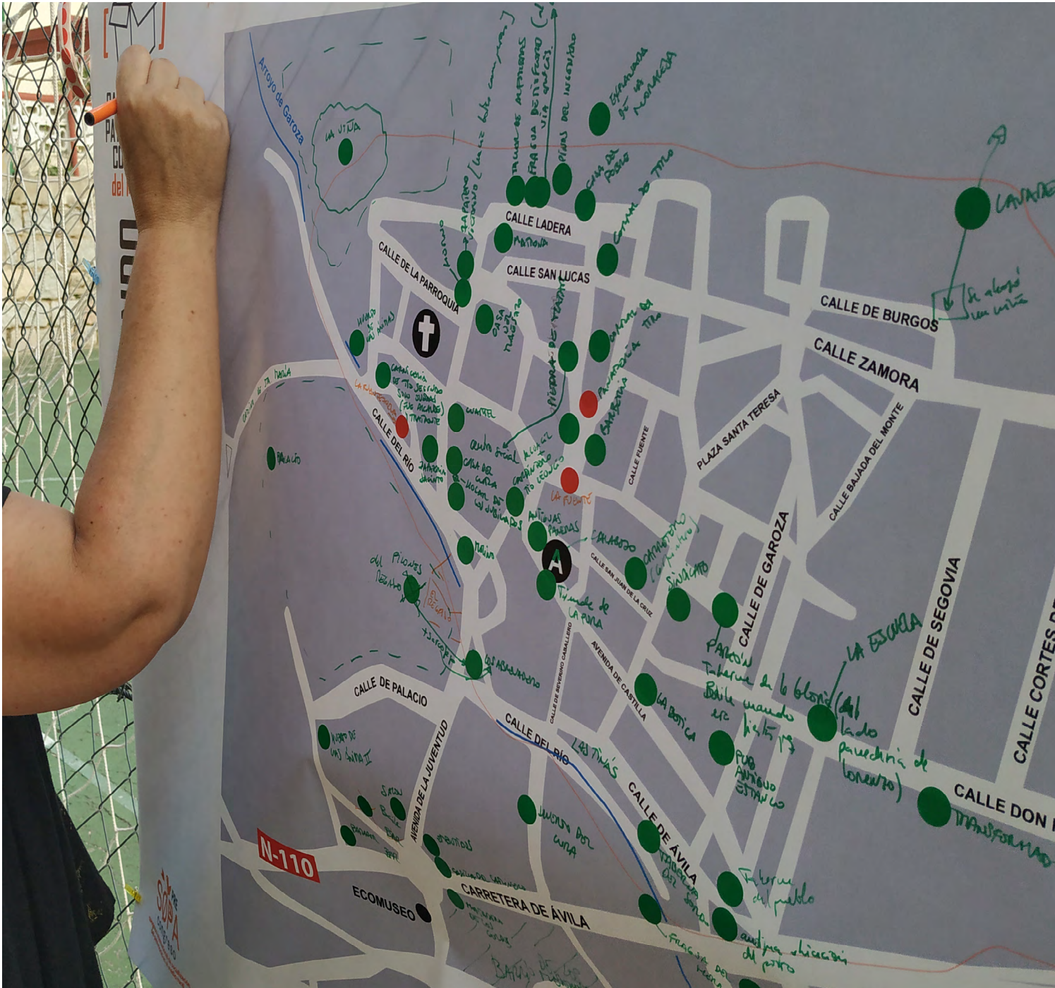
Figura 5. Mapeo en la localidad de Muñogalindo.

3. Cartografía de elementos patrimoniales que recojan los resultados de los paseos patrimoniales y todo aquello experimentado por los participantes: bienes, espacios, conflictos, necesidades, etc.