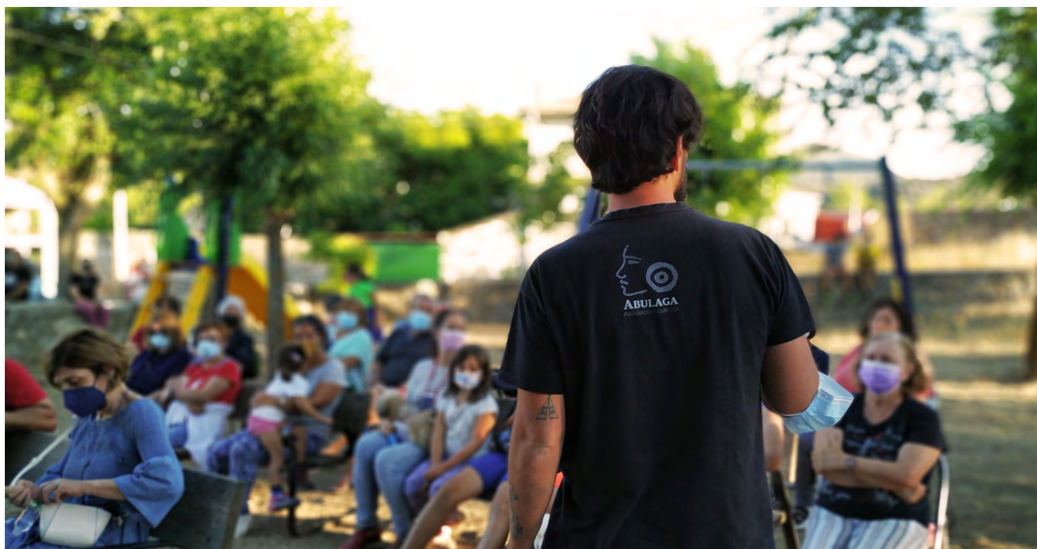
Figura 3. Presentación del proyecto en la localidad de Narros del Puerto.