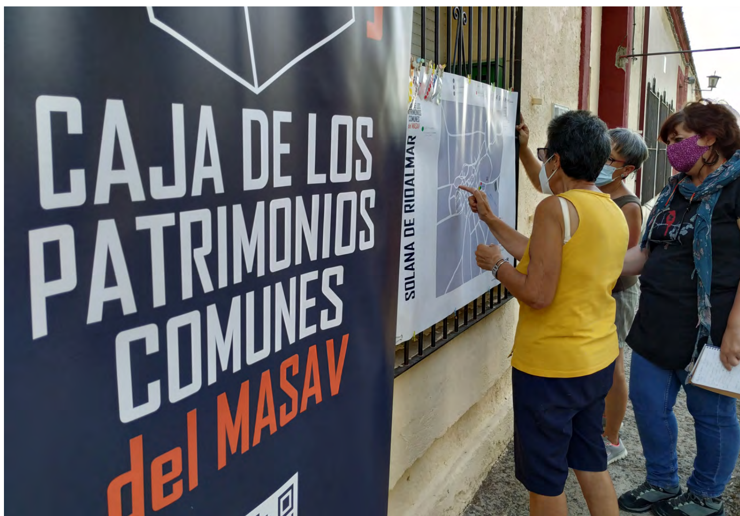
Figura 7. Mapeo en Solana de Rioalmar.

Elementos registrados: Pista de petanca, Virgen de los Remedios, antiguas escuelas, el día de la Viejas, el museo etnográfico, el frontón, El día de los Enamorados, fuentes y pilones, comercios (ultramarinos, farmacia...), El Corral del Concejo, La Casa de los Pobres, las fraguas, los salones de baile.