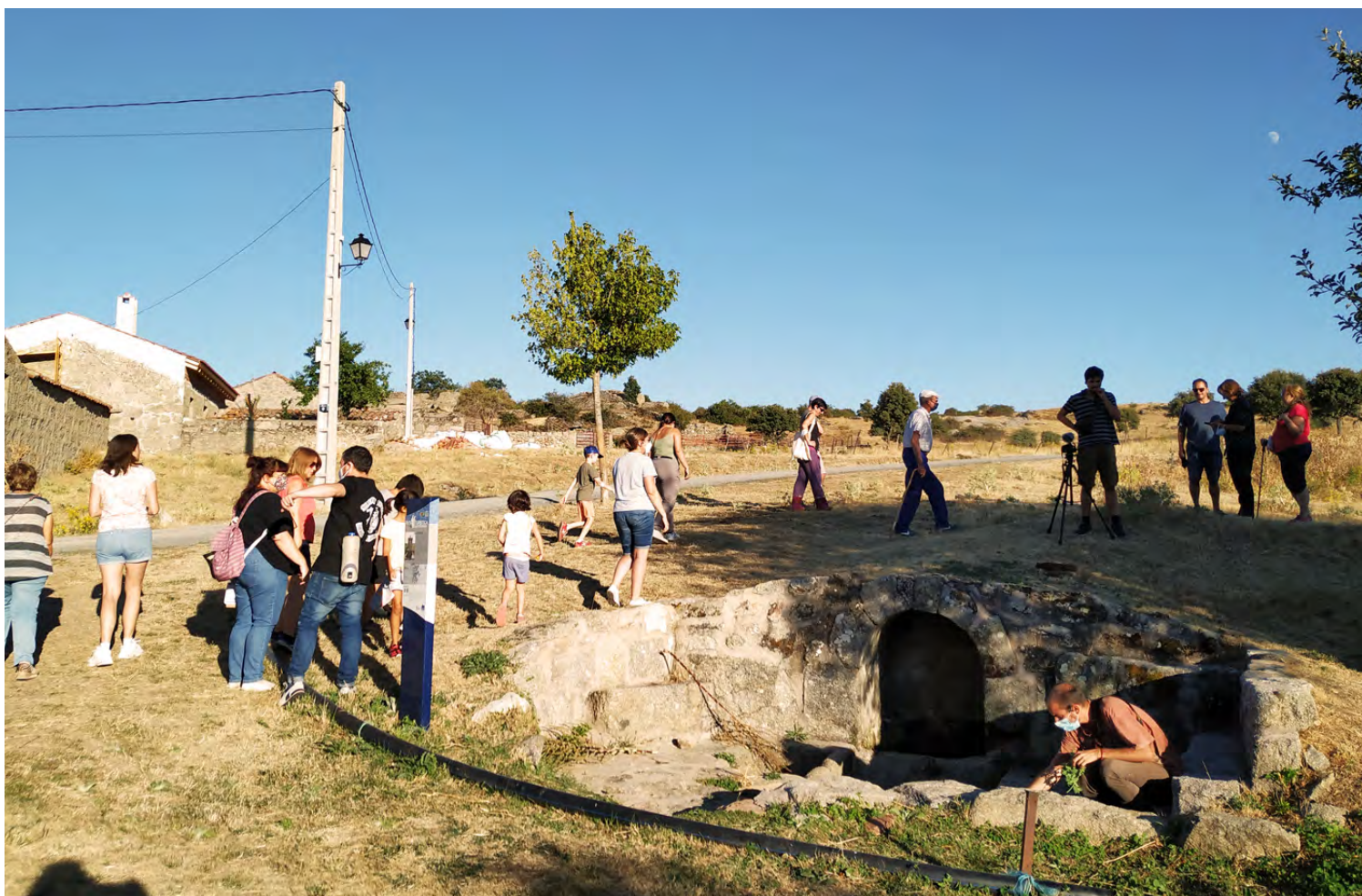
Figura 11. Deriva/paseo en San Juan del Olmo.

Elementos registrados: Casa del siglo XVIII, Comercios, La Fragua, El Cermeñal, El Herrón, El Barco, Los caños, Caminos y Cañadas, Fuentes y Pilonos, El Humilladero, Las Eras, Los Barranqueños, Las Antiguas Escuelas, La Casa del Maestro, Festividades, las Norias, los Cantos, Los Potros, La Piedra de La Tiná.