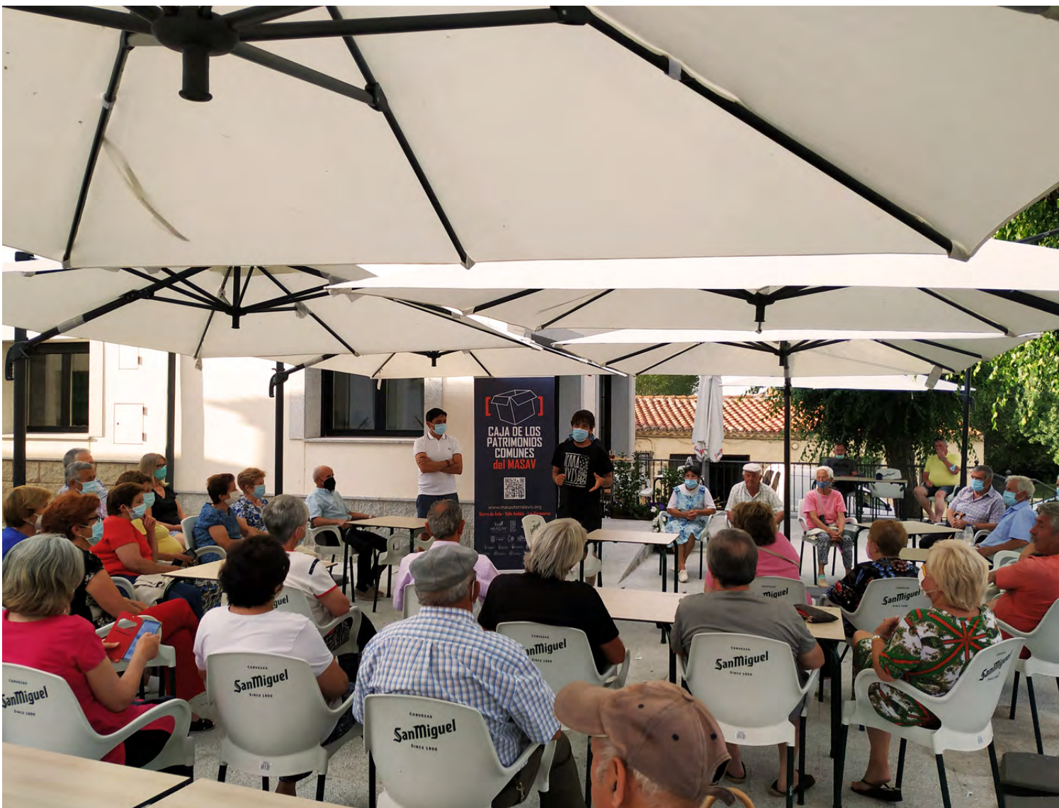
Figura 9. Presentación del proyecto en Ojos Albos.

Elementos registrados: Campo santo, Los Atrasos, las antiguas escuelas, el cementerio antiguo, fuentes y pilones, hornos, el transformador, la casa del teléfono, corrales, molino, corral del concejo, juegos tradicionales (los rondines, el hinue, las señales, la calva...), la plaza de toros, los salones y tabernas, la casa de la maestra, la Iglesia, la fragua, el potro.