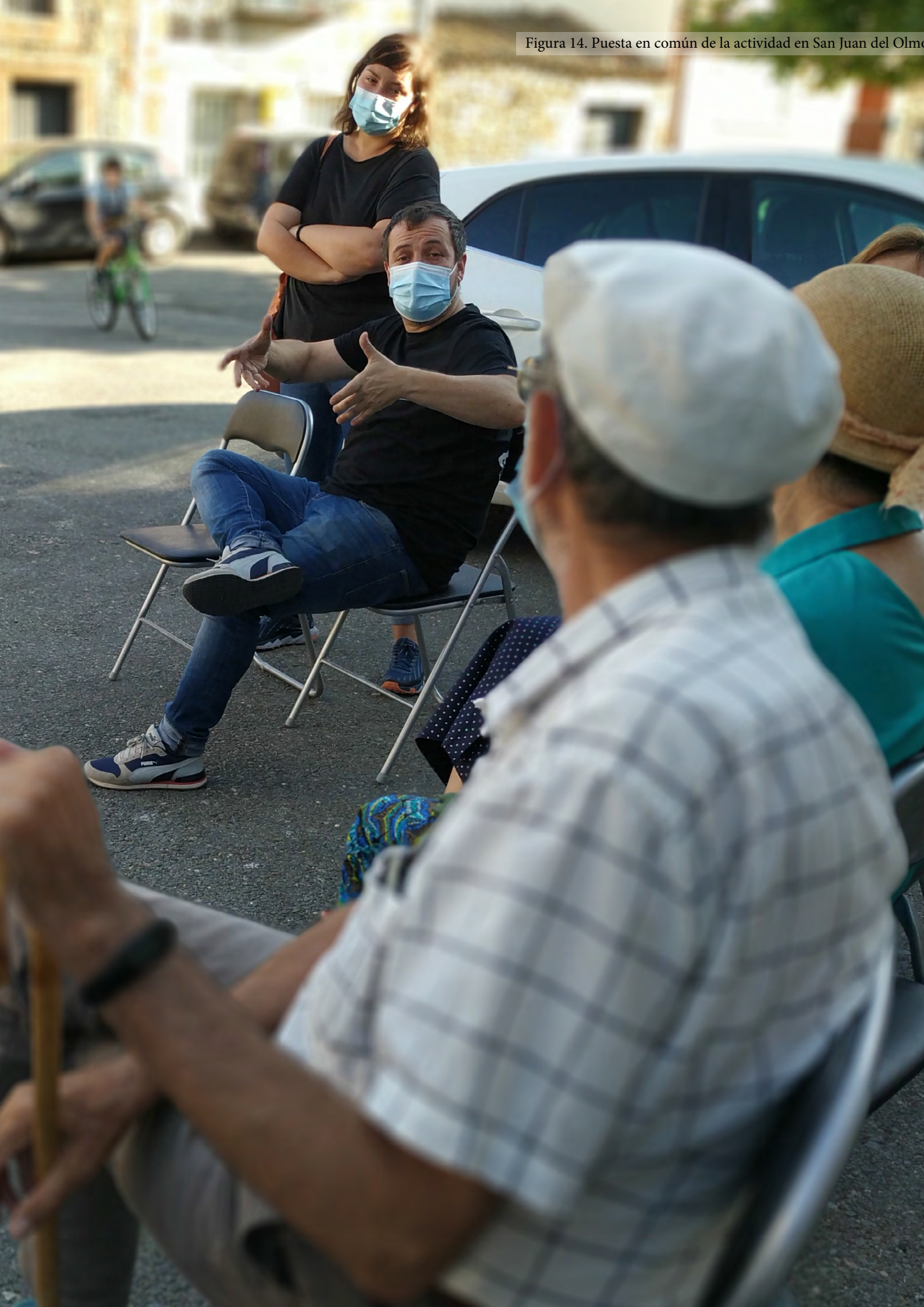
Figura 14. Puesta en común de la actividad en San Juan del Olmo