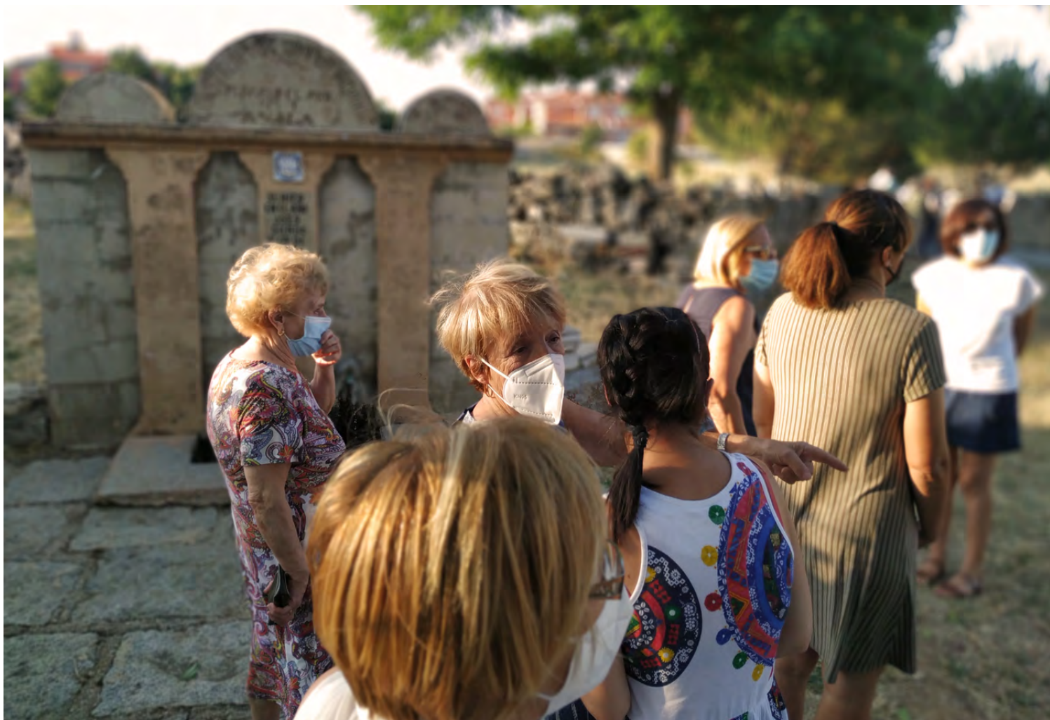
Figura 8. Deriva/paseo en Martiherrero.

Elementos registrados: Cruz de camino, cementerio antiguo, molino, posadas, comercios (ultramarinos, estanco, farmacia...), descansadero de ganado, potro, fuentes y lavaderos, casas de los maestros, casa del teléfono, cañadas y caminos, sanatorio, antiguo ayuntamiento, casa del cura, corral del concejo, Iglesia de Nuestra Señora de la Asunción, antiguas escuelas.