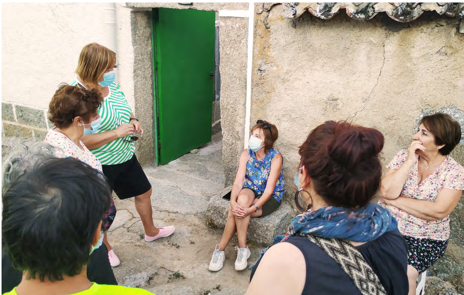
Figura 10. Deriva/paseo en Narros del Puerto.

Elementos registrados: Las eras, las antiguas escuelas, la cruz, las cañadas, el potro, la tejera, las tinás, los muladares, plazas y bailes, hornos, fragua, casa de los maestros, tabernas y comercios, casa del teléfono, antiguo ayuntamiento, el transformador, las regaderas, el corral del concejo y del toro, la casa del cura, la arboleda, la posada.