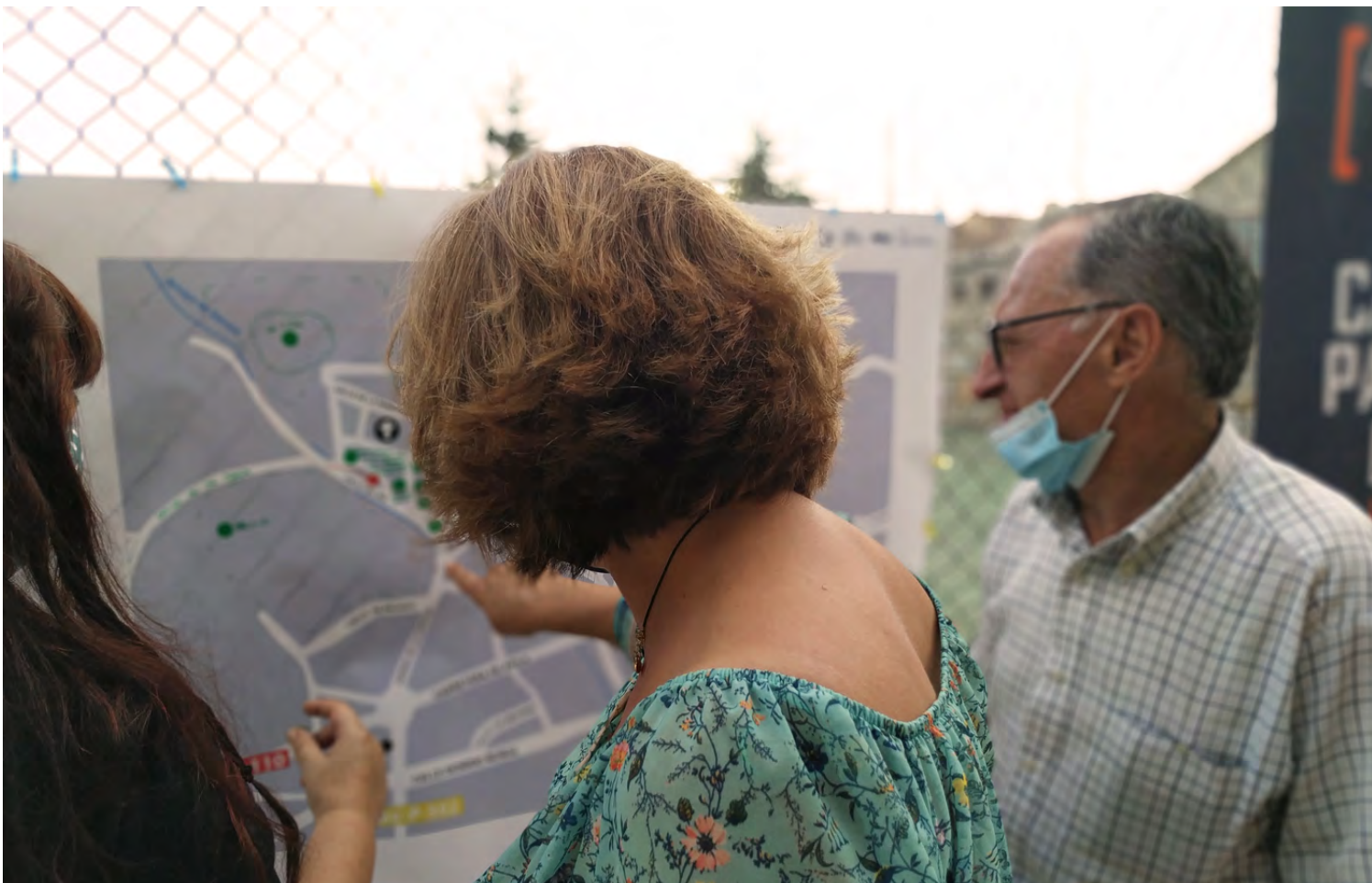
Figura 13. Mapeo en Muñogalindo.

Elementos registrados: La Plaza de la Victoria, el centro social, el corral del toro, el corral del concejo, la explanada de la moraleja, el corral de los pobres, la fragua, el taller de alfombras, la partera, la casa del maestro, las antiguas escuelas, el calabozo del ayuntamiento, el pinar del ingeniero, la casa cuartel, el cine, la taberna y el pareón, la casa del cura y la casa parroquial, el hogar de los jubilados, fuentes y pilones, el parque del regajo, el molino, bares, tabernas y salones, el huerto del cura, la botica, el parador, cordeles y caminos.