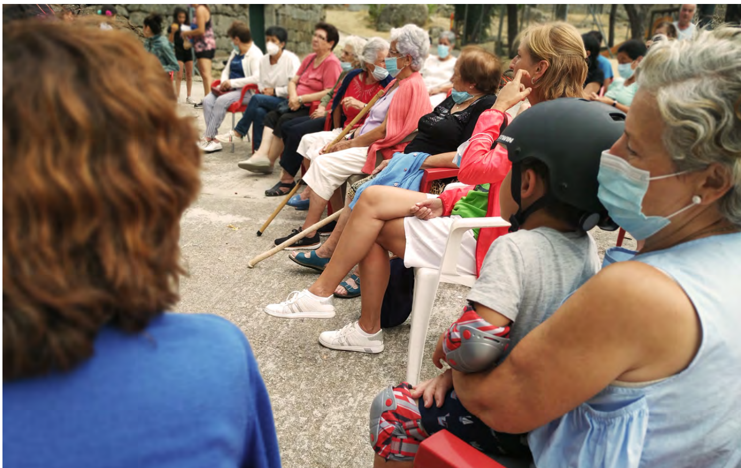
Figura 12. Puesta en común en Altamiro.

Elementos registrados: las antiguas escuelas, el corral del toro, la cruz de piedra, costumbre funerarias, el transformador, la centralita, bares y salones, puentes, casa del maestro, corral del concejo, hornos, casa del médico, fuentes y pilones, fraguas, huertos, el ronchadero, posadas y comercios, la pedrera, los potros, molinos y motores, festividades y juegos tradicionales (la palmeta, la chirumba, la calva, juegos de carta...).