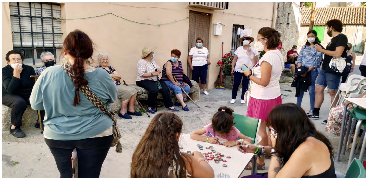
Figura 6. Paseo/Deriva en Villaviciosa.

Elementos registrados: Fuente Palacio, Castillo de Villaviciosa, merendero del Castillo, Fiesta de San Juan (adornos florales), antiguo ayuntamiento, las paneras y hornos, el campanario, comercios y bar.