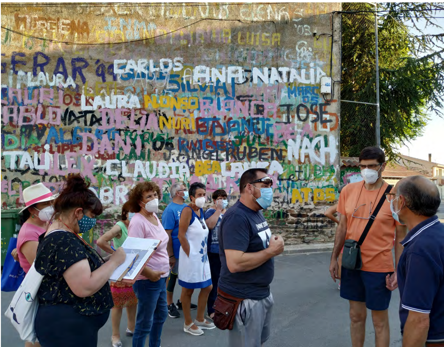
Figura 4. Deriva/Paseo en la localidad de Solana de Rioalmar.

2. Derivas o paseos patrimoniales conscientes desde los que experimentar el territorio, conectando nuestras sensaciones con los elementos patrimoniales y espacios de memoria que transcurren en los recorridos de las distintas localidades.