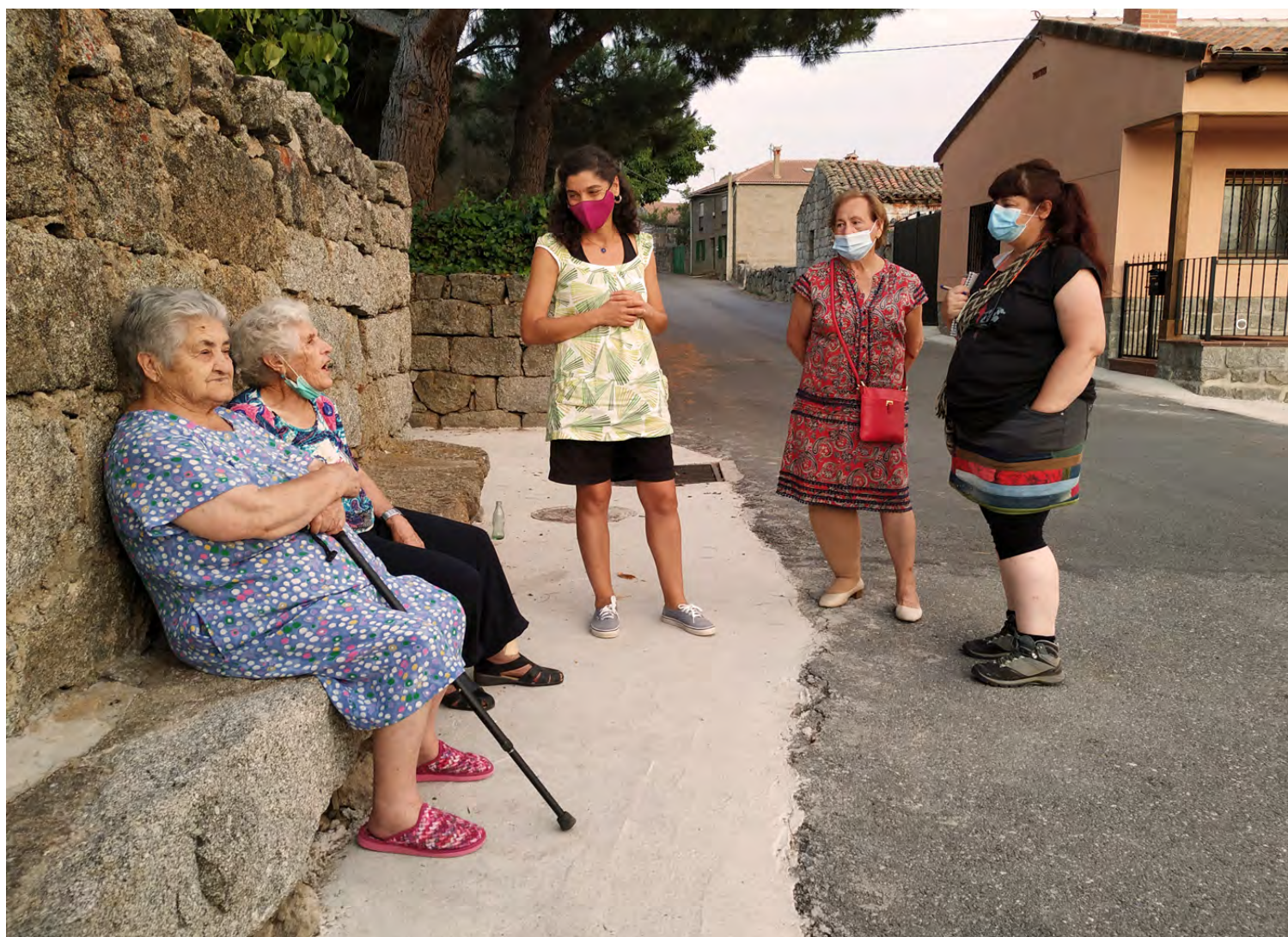
Figura 2. Conversación con mujeres de la localidad de Altamirós.

Considerando la coyuntura demográfica del territorio, en la que la mayor parte de la población es de avanzada edad, hemos adaptado las distintas dinámicas a esta realidad, por lo que en todo momento hemos utilizado las herramientas más adecuadas para cada momento (por ejemplo, mediante el uso de material analógico que se pondrá a disposición de los Ayuntamientos para facilitar la participación de personas con dificultades para acceder a la plataforma digital).