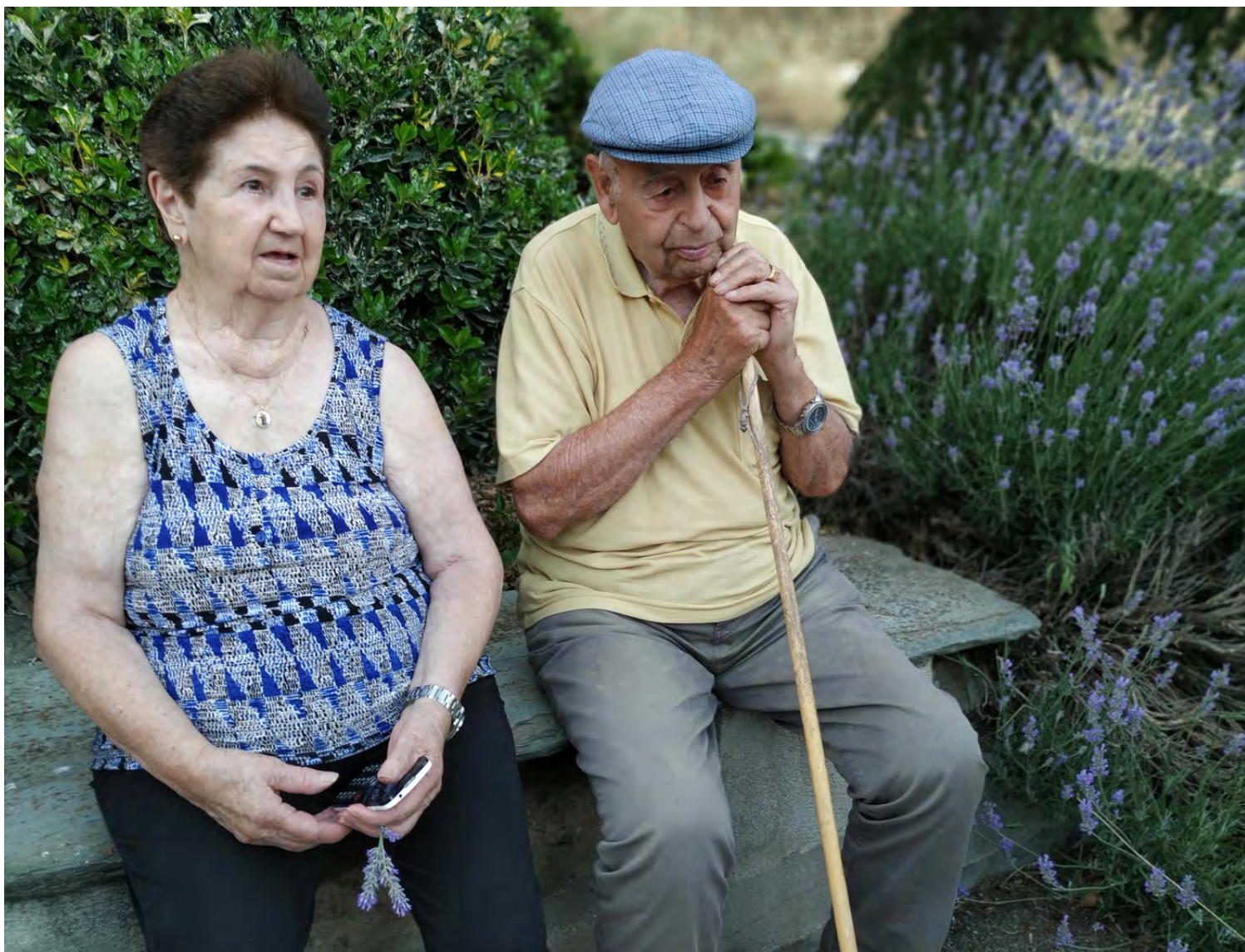
Figura 1. Vecinos de la localidad de Solana de Rioalmar.

El ámbito de trabajo de la Asociación Cultural Abulaga es el rural de la provincia de Ávila, uno de los territorios con menor densidad de población del país, un factor que se extiende a gran parte de sus municipios. Y es que la despoblación continúa su avance año tras año en la provincia de Ávila, que actualmente cuenta ya con 94 municipios con menos de 100 habitantes, lo que representa un 38% del total, situación que se agrava con otro dato preocupante, pues la media de edad en esos ‘micro-pueblos’ supera los 60 años, lo que refleja el fuerte envejecimiento de la población en el medio rural abulense. En casos como estos se aprecia que no solo la despoblación es un problema, sino también los desequilibrios entre las zonas rurales y las urbanas. Y es que si estamos viendo como poco a poco, además de población, estos territorios están perdiendo recursos y servicios, se hace fundamental el desarrollo de procesos sociales que si bien no puedan impedir ese abandono del rural, sí que al menos pueden ralentizarlo, o buscar estrategias para contrarrestarlo.