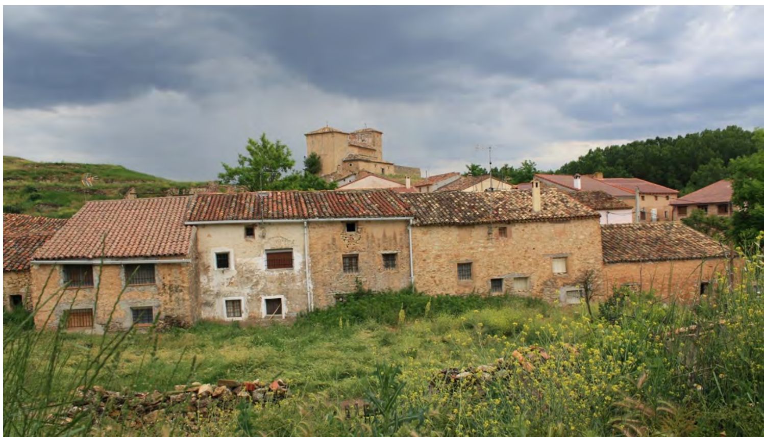
Figura 3. Paisaje de Pradilla.

Esta intervención está en proceso de terminarse porque en el año 2020 cuando estábamos planeando la campaña de verano que nos permitiera concluir la intervención del retablo mayor, pues como todos sabemos lamentablemente nos encontramos de frente con la pandemia que nos impidió regresar a Concha y poder continuar con los trabajos tanto el retablo mayor como en el resto de los bienes culturales que nos quedan por intervenir también en Fuentelsaz. Se espera poder intervenirlos durante la campaña de verano del año 2022, con la esperanza de que la pandemia se haya superado por completo.