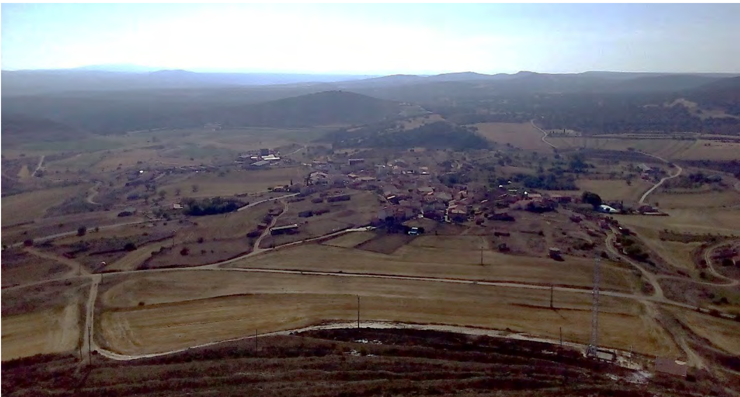
Figura 4. Paisaje de Fuentelsaz.

Los habitantes del medio rural son los grandes olvidados, pero sobre todo es obvio que en el medio rural la mujer vive en desigualdad (Sánchez, 2019). En la mayoría de los casos, a la mujer se le sigue asignando el papel de cuidadora que, a su vez, en muchos casos se ve reflejado en la relación que establece con el patrimonio de su municipio: son las mujeres las que limpian los templos, las que durante las restauraciones que hemos llevado a cabo han venido a cubrir con sábanas las imágenes para que no se dañen. Aunque tanto hombres como mujeres se impliquen en nuestros proyectos, son ellas las que cuidan y protegen de su patrimonio.