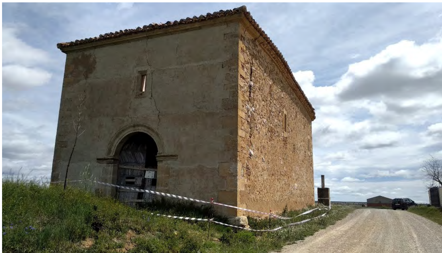
Figura 6. Exterior de la ermita de Nuestra Señora de la Soledad (Campillo de Dueñas).

La mayoría de los bienes culturales que se pueden encontrar en estas ermitas son esculturas de madera policromada, retablos de pequeño y mediano formato y alguna pintura de caballete. Es menos frecuente encontrar decoraciones pictóricas sobre los muros. En general, los daños que presenta la totalidad de este patrimonio han sido causados por diversos factores: