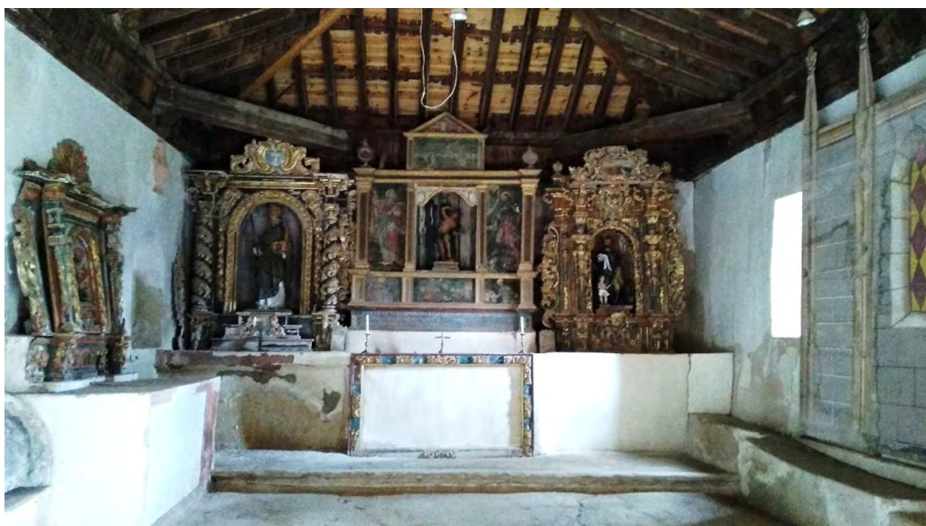
Figura 5. Interior de la ermita de San Sebastián (Tartanedo).

Todo esto ha propiciado un mayor interés y con ello, el nacimiento de nuevos proyectos como es el caso de la tesis doctoral que se está presentando y que actualmente está en curso. Esta persigue poner en valor y reactivar el valioso patrimonio de las ermitas de los diversos municipios que se encuentran en esta zona, para que no se pierda con el paso del tiempo y pueda ser valorado y disfrutado por las generaciones venideras.