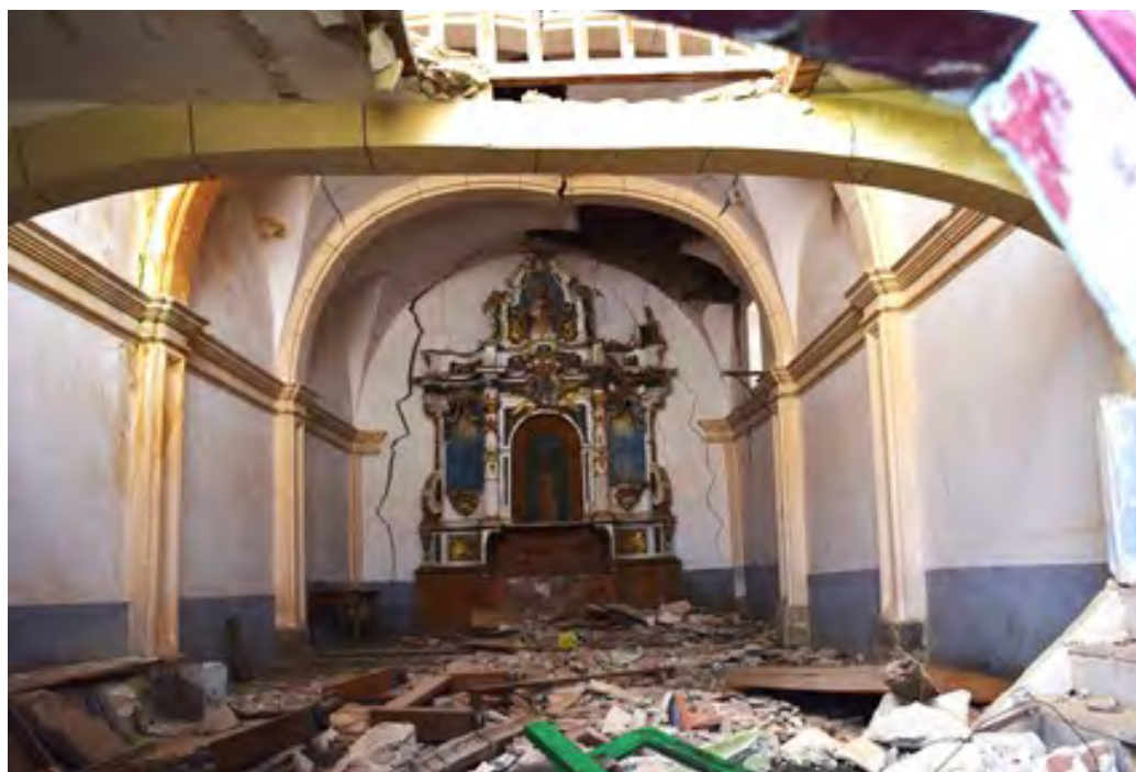
Figura 1. Interior de la ermita de la ermita de Nuestra Señora de la Soledad (Campillo de Dueñas).

Este proyecto surgió ante la necesidad de intervención en un patrimonio cultural principalmente eclesiástico, concretamente retablos mayores de las iglesias, que se encontraba en un estado de conservación lamentable. Este patrimonio cultural es, por tanto, el reflejo del abandono general que sufren estas poblaciones