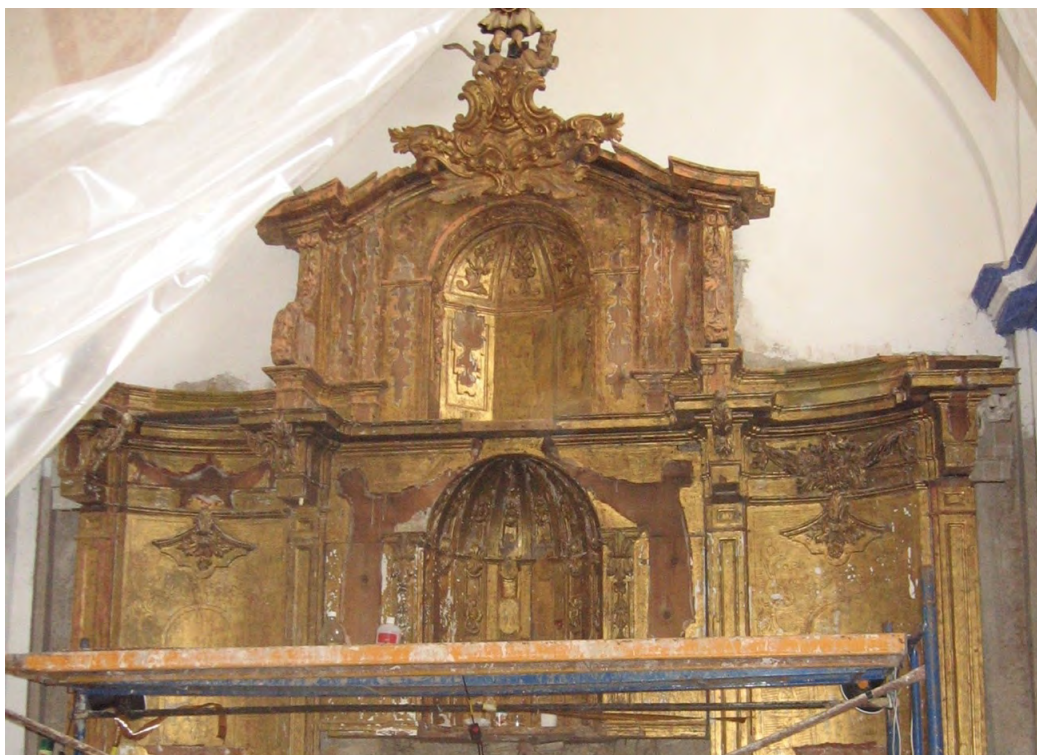
Figura 2. Retablo mayor de la Iglesia de Pradilla durante el proceso de intervención.

El primer retablo que se intervino hace casi 20 años como decíamos, fue el de la Iglesia de Padilla y se inició la intervención en el año 2003. El alcalde Teodoro Gaona se puso en contacto con el Departamento de Conservación y Restauración de la UPV, y con Enriqueta González. Se hizo una valoración del estado de conservación, que era muy muy dramático y estaba al borde de la desaparición y se pusieron en marcha para para arrancar estos trabajos en el año 2003. En Pradilla después del retablo mayor se hizo la restauración del resto de bienes culturales muebles e inmuebles por destino y aquí en Pradilla se estuvo trabajando durante los siguientes ocho años, bueno, ocho campañas, ya que no son años naturales.