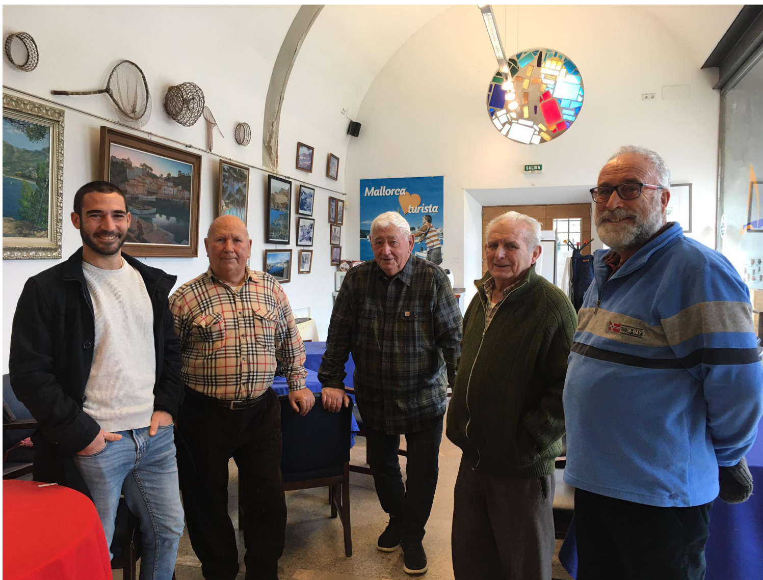
Figura 5. Algunos de los protagonistas de La remor de la memoria .

Finalizada la investigación, se deben negociar nuevos escenarios de participación en los que la comunidad siga siendo parte del museo.