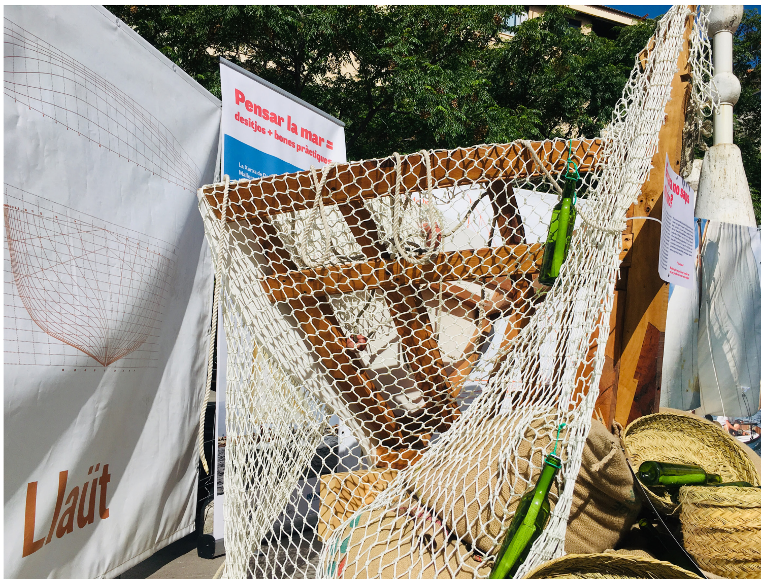
Figura 3. La Xarxa dels Desitjos, en su formato itinerante.

En la imagen anterior se observa la forma de la instalación participante itinerante. La intervención, además, coincide con la apertura de una de las sedes permanentes del MMM, la sede en el puerto de Sóller, y se decide hacer una réplica de la instalación en este espacio: en este caso, en la entrada del museo. En el puerto de Sóller la instalación estuvo activa entre el 1 de junio al 2 de julio.