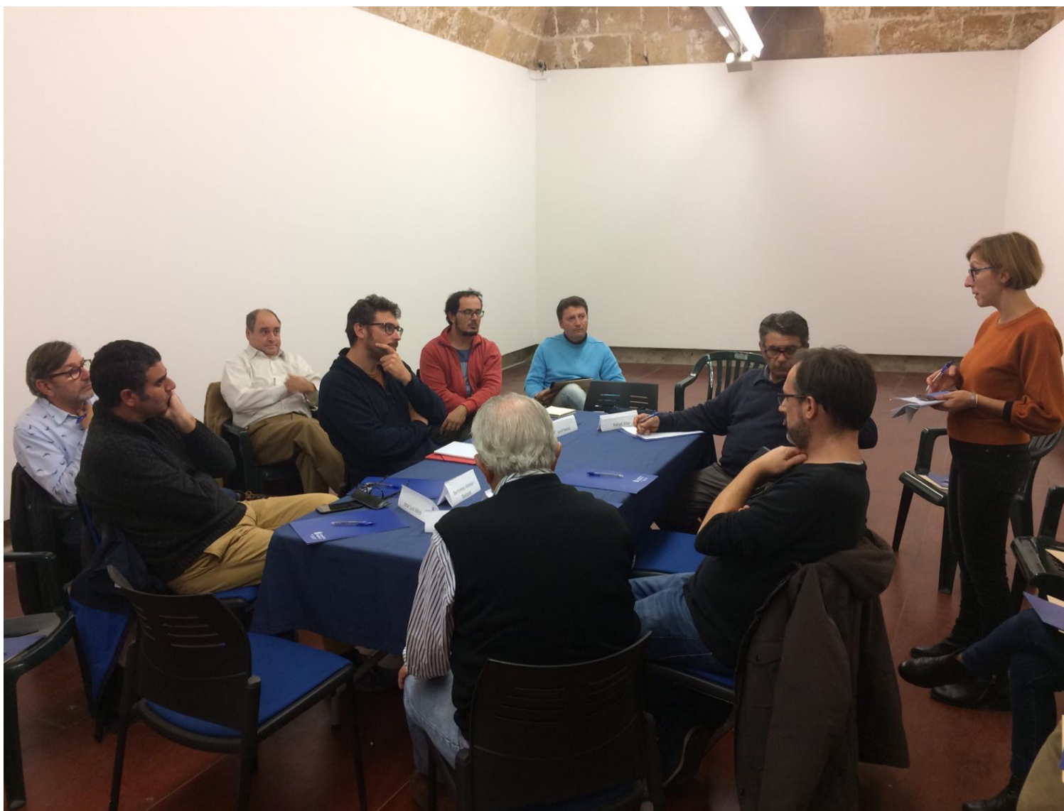
Figura 2. Participantes de la sesión de trabajo.