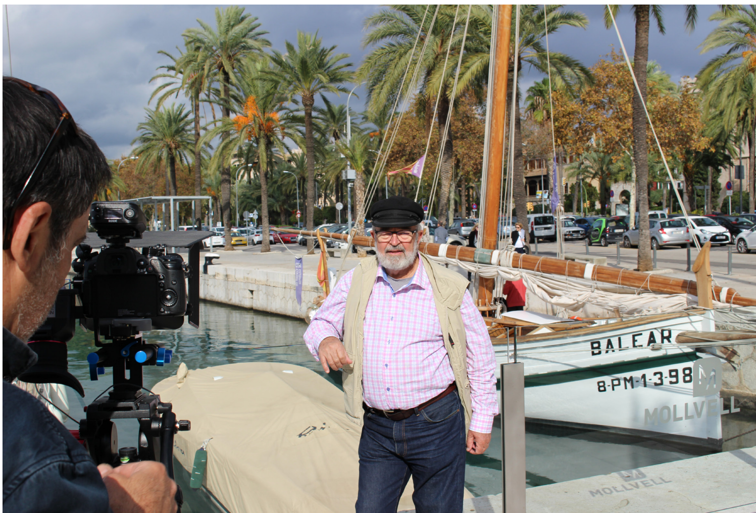
Figura 1. ¿I tú, que museo te imaginas?

El 26 de noviembre, se plantea una sesión de devolución de los resultados de las entrevistas como parte del proceso de participación y se plantea una dinámica participativa que consiste en un grupo de discusión doble.