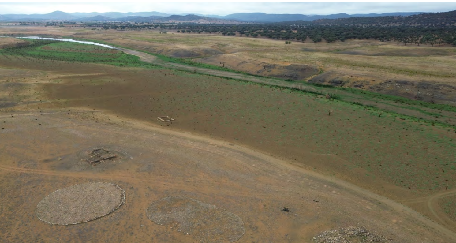
Figura 3. Imagen general del valle, en la que se puede ver retazos sobre el paisaje agro-ganadero.