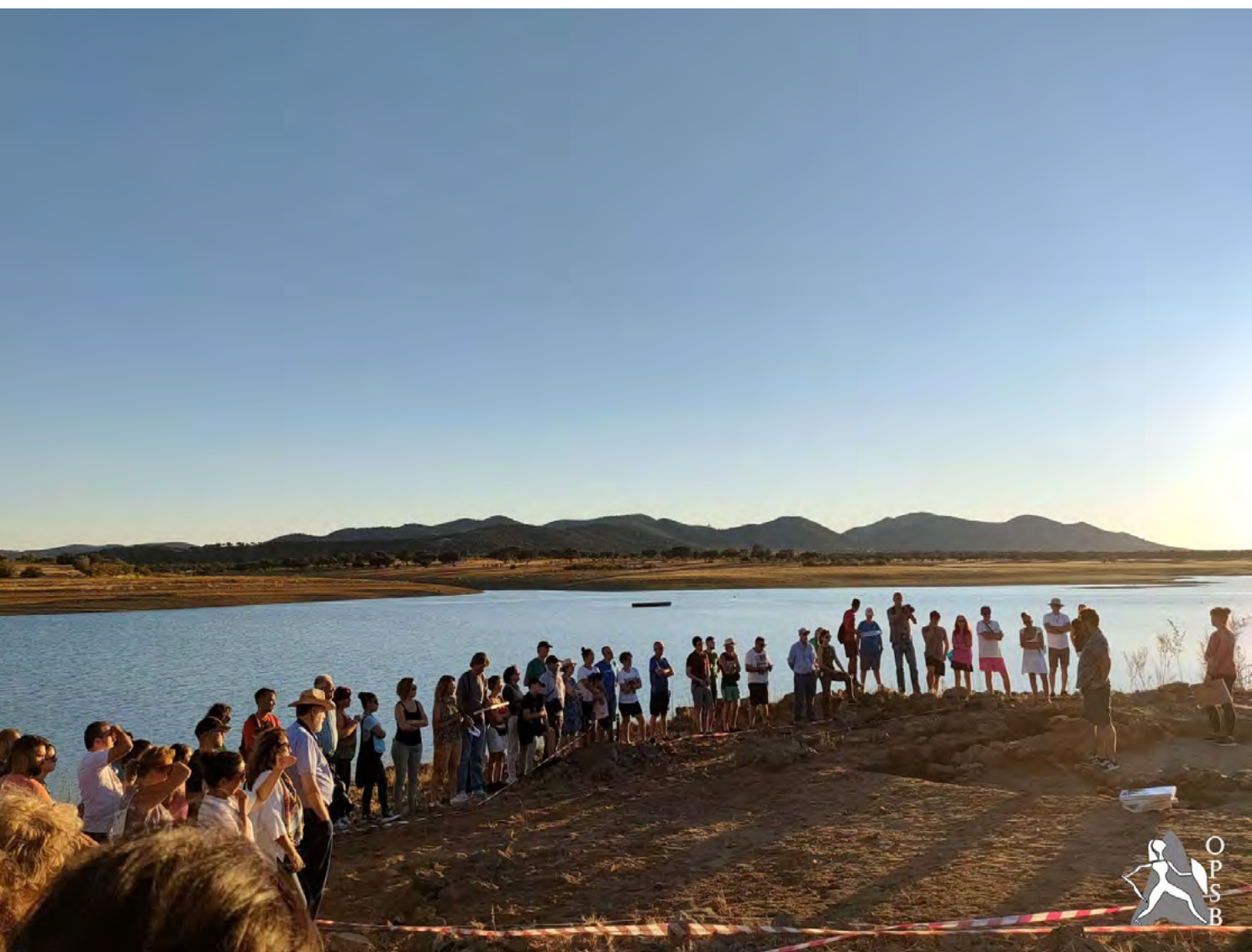
Figura 1. Imagen de una de las jornadas de puertas abiertas durante la campaña de excavación.