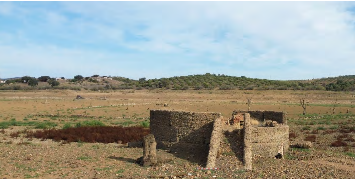
Figura 4. Ejemplo de unos de las construcciones etnográficas documentadas, consistente en una noria de tiro .

En la actualidad nos encontramos realizando la consulta de archivos para poder rastrear las parcelaciones y compararlas con la documentación arqueológica generada, así como la entrevista a diversos agentes locales que están compartiendo su saber y memoria.