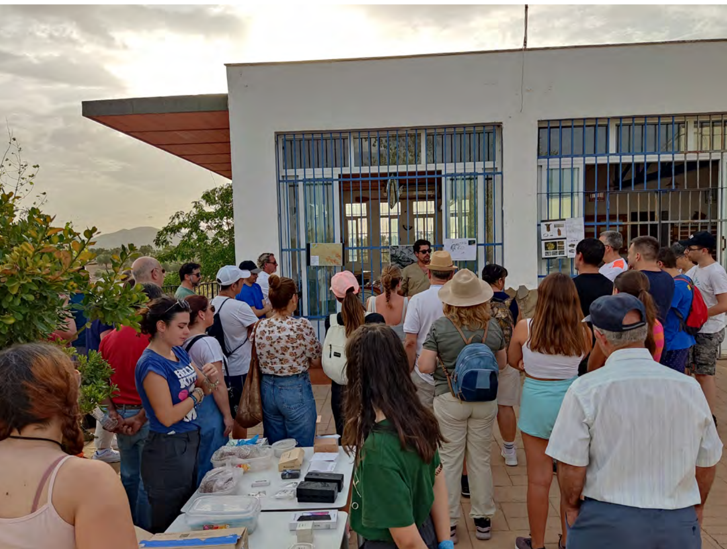
Figura 2. Imagen de las jornadas de puertas abiertas, en las que se implementó una visita al trabajo de laboratorio.

Durante la presentación de resultados, se unieron dos intervenciones, la excavación del OPSB así como la prospección del fondo del valle de embalse. Respecto a esta última actividad arqueológica durante el verano de 2023, se mantuvo la terrible sequía que asolaba la comarca, lo que hizo que todas las huertas, antes inundadas y olvidadas emergieran. Esta situación nos dio la oportunidad de intentar reparar la identidad olvidada y coser la línea de creación de identidades mediante oposición urbano-rural, que se situaba en esta zona, que para alguno era un lugar identitario por la capacidad de pescar o hacer deportes náuticos, pero no por el pasado cercano olvidado. Durante este momento, son muchas las voces que nos comienzan a hablar de “mi padre vivía en el cortijo que se empieza a ver en...” o “yo recuerdo cuando se desbordaba el río y las huertas” o “lo bonito que estaba el río cuando tenía las huertas”. Es aquí cuando comenzamos con la oportunidad de establecer un proyecto conjunto entre arqueología, archivos y memoria que pretendía recuperar el pasado de una zona que hasta ahora sólo podíamos ver desde la protohistoria, el río Guadiato, dejando a un lado el “embalse de Sierra Boyera” (fig. 3).