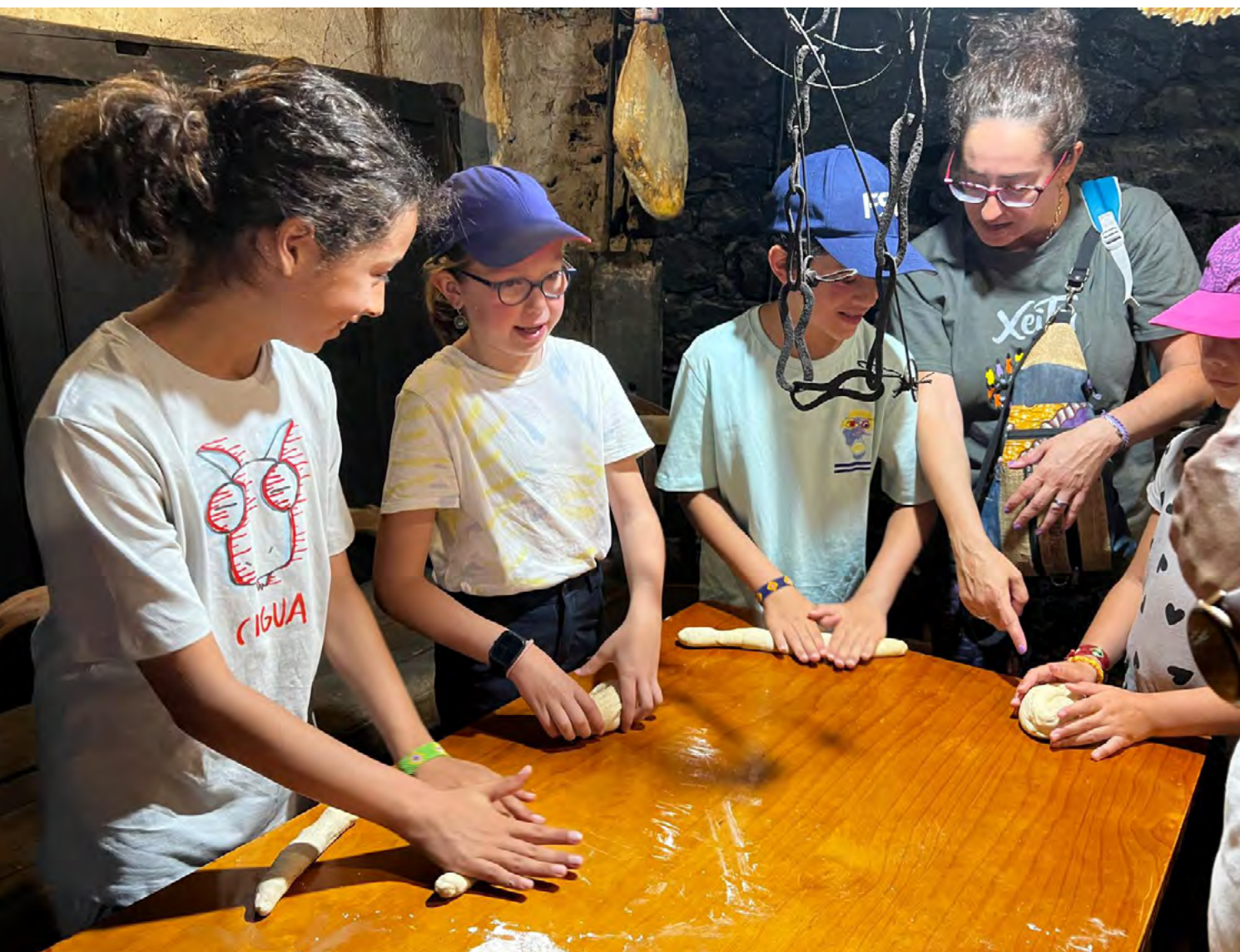
Figura 2. Imagen de los talleres que se celebran cada verano en Vigaña (Belmonte de Miranda).

Desde LLABOR-Social Landscapes somos conscientes de la necesidad de implicar a las comunidades en nuestro trabajo. Por ello, a lo largo de los años ha sido necesario innovar y abrir nuevas vías para la transferencia del conocimiento. El reto es atraer nuevos públicos y conseguir que el conocimiento científico y la educación patrimonial lleguen a todos los grupos sociales, y esto no sólo debe hacerse a través de la formación no formal o informal, sino que es imprescindible su incorporación a la educación formal. Por este motivo, desde el grupo se vienen desarrollando diversos proyectos de investigación aplicada, entre los que destacamos ConCiencia Histórica, una propuesta didáctica que persigue enseñar el método científico al alumnado de primaria a través de la arqueología, a la vez que se fomentan los valores identitarios y de custodia del patrimonio y el territorio rural (FERNÁNDEZ MIER et al. , 2021).