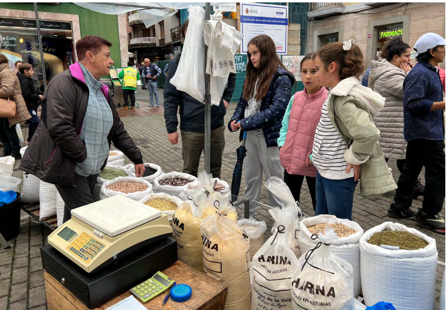
Figura 3. Imagen de una de las salidas de motivación. Niñas del colegio de El Fresno entrevistan a una de las vendedoras del mercado de Grau/Grado.

ConCiencia Histórica es un proyecto enfocado hacia la población infantil y juvenil, con el objeto de favorecer que los más jóvenes tengan un mayor conocimiento del espacio en el que viven. A través del descubrimiento de los valores patrimoniales de su entorno se pretende fomentar la creación de elementos identitarios que eviten la migración al mundo urbano, potenciando las alternativas rurales a los referentes metropolitanos (FERNÁNDEZ MIER et al , 2023). Paralelamente, se promueve la formación en cultura científica de los escolares del medio rural, que por su situación geográfica tiene menos posibilidades de participar en actividades de transferencia, generalmente desarrolladas en las ciudades.