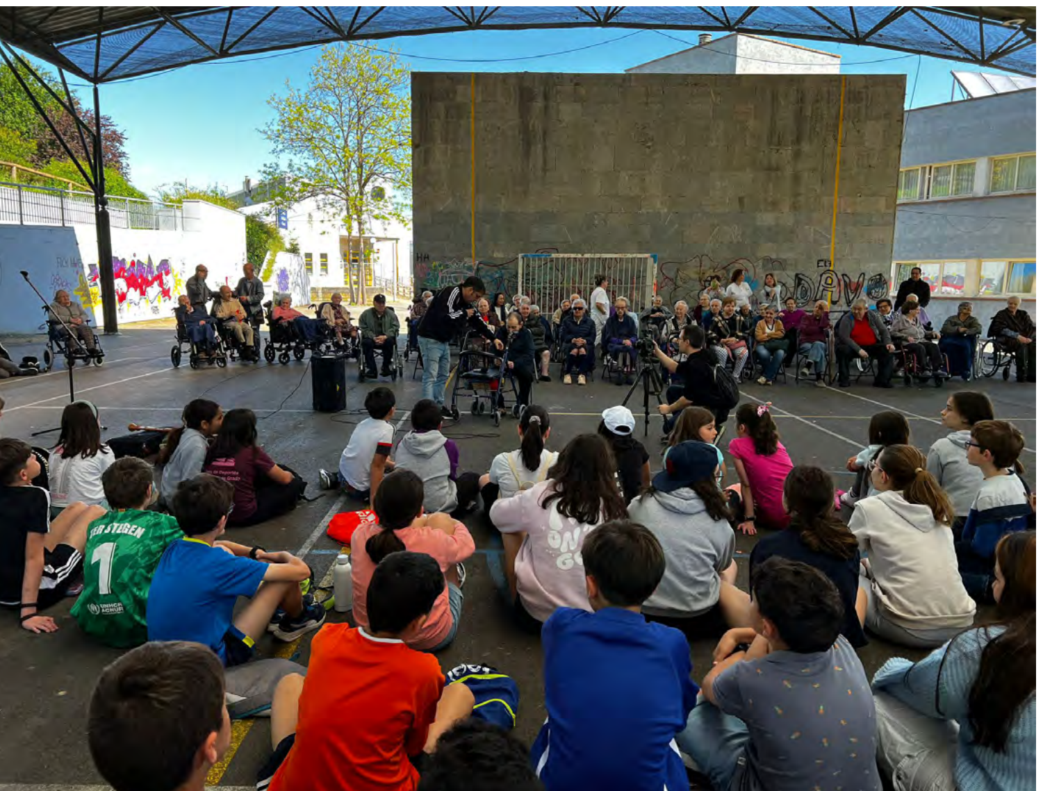
Figura 5. Imagen de uno de los conciertos didácticos ofrecidos por el ATOAM para el alumnado y pacientes de las residencias del ERA y centro de día de Grau/Grado.

El hilo conductor de este último año tiene por título El Camín Real de la Mesa. Viajes y viajeras: personas, ideas y mercancías . Toma como referencia esta vía histórica que une la Meseta con la costa asturiana y que discurre por los dos municipios que participan en el proyecto. Con este eje cultural y paisajístico, el programa educativo gira en torno a diversas actividades encaminadas a mostrar el trabajo científico que se realiza en arqueología: desde la realización de una excavación arqueológica real en sendos yacimientos locales hasta las labores de laboratorio, que incluyen metodologías como la arqueobotánica, zoorqueología, el estudio de la cerámica y la alfarería, la teledetección, el LiDAR o la fotogrametría. Junto a ello, se han realizado salidas de campo para conocer el patrimonio del entorno y los paisajes, así como talleres de tradición oral y música tradicional, para conocer el patrimonio inmaterial. El culmen del proyecto coincide con el fin de curso, en junio de 2024, con una exposición temporal donde el alumnado puede mostrar los resultados de su aprendizaje en el proyecto de investigación en una institución museística de referencia (el Museo Arqueológico de Asturias), exposición que se desplazará a otros centros culturales de los territorios rurales en los que trabajamos.