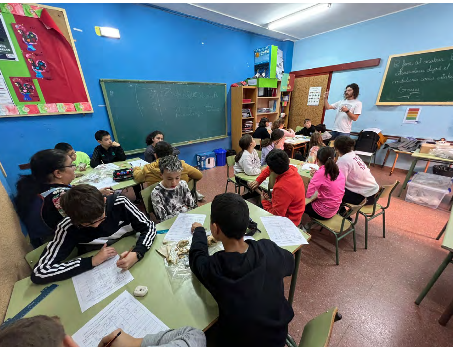
Figura 4. Imagen de uno de los talleres de arqueozoología en el colegio Virgen del Fresno (Grau/Grado).

En el curso 2023-24 se incorpora al proyecto el municipio de Grau/Grado como espacio de trabajo, integrando a nuevos agentes colaboradores que aumentan significativamente su alcance: ayuntamiento; colegios públicos “Bernardo Gurdíel”, “Virgen del Fresno” y “La Mata”; la residencia de personas mayores local (ERA); el Museo Etnográfico y de Historia local, el Archivu de la Tradición Oral d’Ambás (ATOAM), el Museo Arqueológico de Asturias y el centro de investigación del Servicio Regional de Investigación y Desarrollo Agroalimentario (SERIDA). De esta forma, el proyecto comienza a trabajar simultáneamente con las comunidades educativas de Balmonte/ Belmonte de Miranda (1.425 habitantes y 50 estudiantes de educación infantil y primaria) y Grau/ Grado (9.616 habitantes y en torno a 600 alumnos de primaria distribuidos entre los tres centros educativos públicos del municipio, de los cuales participan en el proyecto 150). Las edades de los escolares con los que se trabaja están comprendidas entre los 3 y los 12 años.