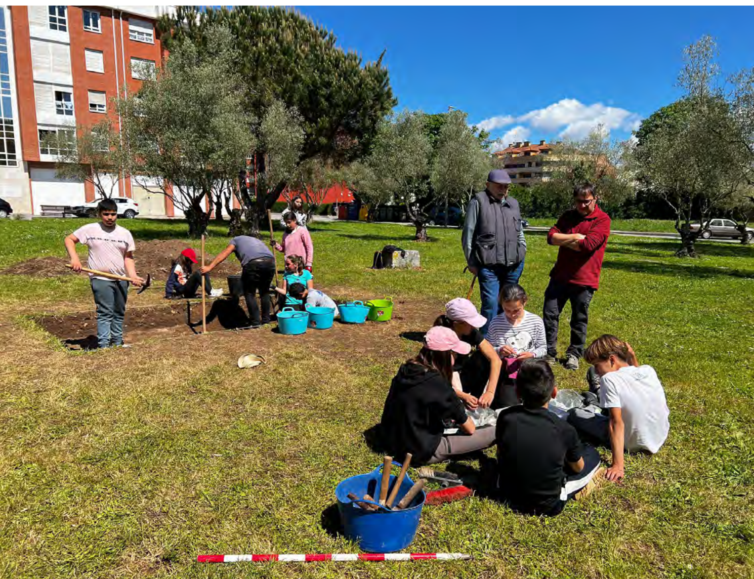
Figura 6. Excavación arqueológica de El Casal (Grau/Grado).

El programa de actividades se distribuye a lo largo del curso, y trata de hacer partícipe al alumnado de la creación de conocimientos a través de su implicación en el uso de metodologías científicas. Dichas actividades están coordinadas por los miembros del equipo LLABOR-Social Landscapes, y en ellas colaboran investigadores expertos en las áreas de conocimiento que se trabajan. De esta forma, la colaboración entre profesorado, investigadores, familias, comunidad local y alumnado favorece un aprendizaje significativo y la adquisición de conocimientos y competencias, de forma que los propios escolares se conviertan en protagonistas del proceso de aprendizaje. Además, el proyecto ha facilitado la aplicación de los principios desarrollados en la nueva ley educativa (LOMLOE), cooperando con los colegios en el diseño de proyectos educativos de centro y situaciones de aprendizaje relacionadas con el entorno del alumnado. De esta forma, el proyecto ConCiencia Histórica se integra en las programaciones didácticas de los centros educativos y favorece la colaboración con los organismos públicos de investigación.