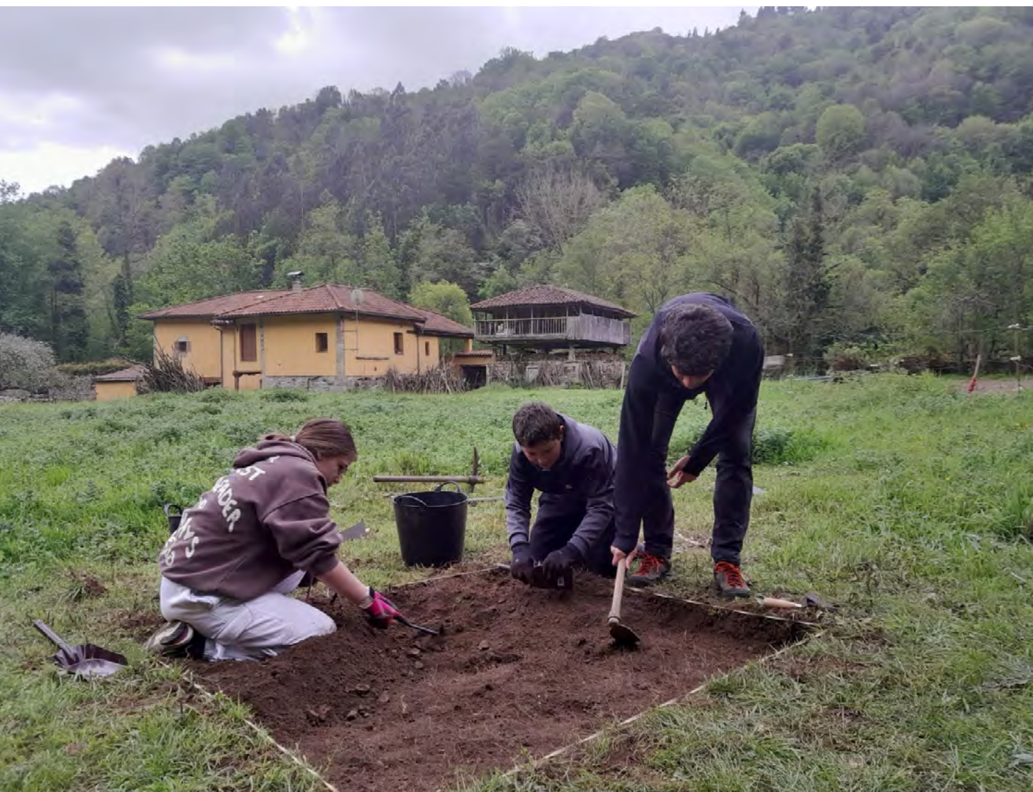
Figura 1. Trabajo arqueológicos de los escolares de Belmonte.

Los proyectos de educación patrimonial y ciencia abierta ofrecen interesantes oportunidades para afrontar los retos de futuro que se plantean en el medio rural. La educación patrimonial tiene como objetivo acercar los bienes culturales a diversos colectivos y hacerlos comprensibles a través de diferentes herramientas. Para ello, existen numerosas estrategias para su didáctica en diversos contextos, en los ámbitos formal, no formal e informal. En el caso de las áreas rurales encontramos una casuística particular, ya que son territorios que en la actualidad afrontan una serie de retos (crisis demográfica, envejecimiento, despoblación, transformaciones de los modelos productivos y sociales, etc.) que también afectan a la pérdida de la cultura tradicional y el patrimonio material e intangible. Para afrontar una parte de esta problemática, la educación patrimonial se ha convertido en una de las estrategias clave en la conservación de todo este acervo cultural, fomentando que niñas y niños y la población joven de estos espacios perciban el lugar en el que viven como un espacio de oportunidades para el futuro, manteniendo el apego a su territorio y su propia identidad (UÑA-ÁLVAREZ et al. , 2019).