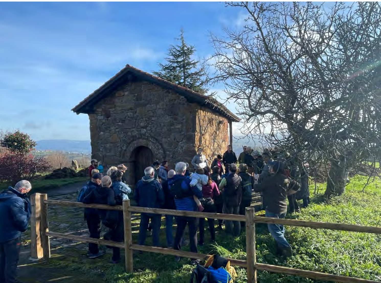
Figura 1. Imagen de la ermita de San Pedro de Abrisketa durante unas visitas.

En este sentido, y desde este enfoque de arqueología comunitaria, podemos señalar el proyecto ConCiencia (LÓPEZ-GÓMEZ y FERNÁNDEZ-MIER, 2022), un proyecto arqueológico en el medio rural que focaliza la atención en la investigación de las aldeas habitadas aún en la actualidad, tomando dos pueblos asturianos como laboratorio de investigación con el objetivo de comprender los procesos de conformación del paisaje en la larga duración. Un claro referente a la hora de plantear nuestro proyecto. Otras iniciativas, se pueden centrar más en proyectos más urbanos, relacionados con la prehistoria y la participación ciudadana (DÍAZ-ANDREU, PASTOR y PÉREZ, 2016). A nivel europeo, señalamos el Proyecto LOGGIA 4 , que diseña y lleva a cabo actividades a medida centradas en el paisaje histórico, con la participación de distintos públicos y evaluando su implicación a través de un nuevo marco de evaluación. Así como el proyecto CARE MSoC 5 que pretende capacitar al sector del patrimonio para que contribuya a afrontar los retos sociales propios de las comunidades rurales, explorando el impacto de prácticas participativas específicas y contextualizadas. O el proyecto Mappalab, enfocado en los recursos digitales en la arqueología, plantea una línea de actuaciones educativas potentes centradas en talleres, digitalización, medio ambiente o metodología arqueológica 6 .